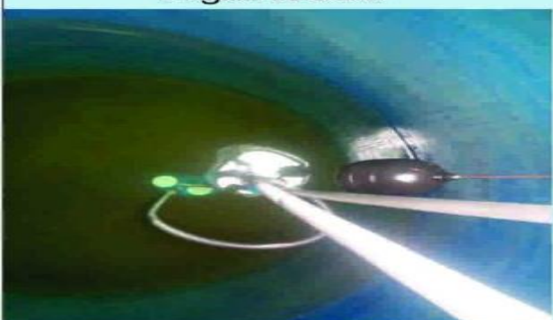
caixa d'água Antes